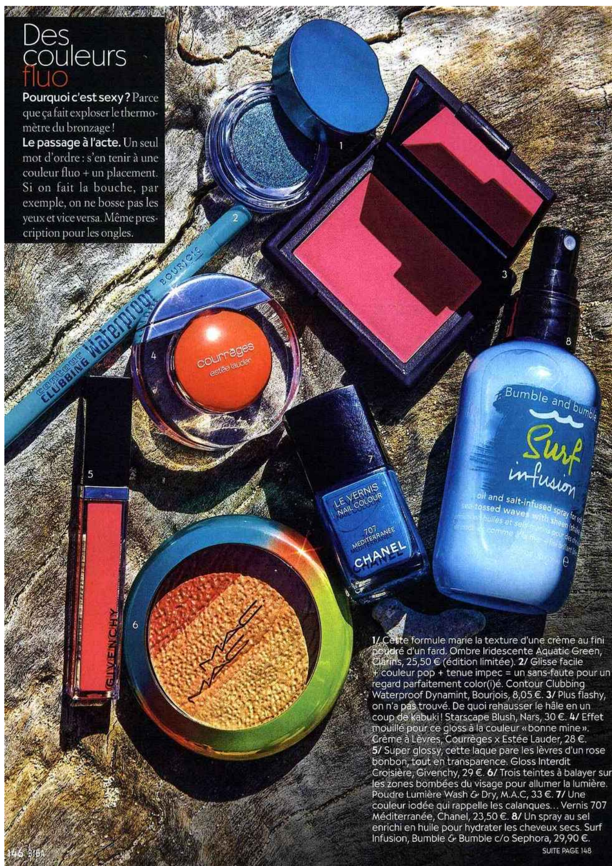
1/ Cette formule marie la texture d'une crème au fini poudré d'un fard. Ombre Iridescente Aquatic Green, Clarins, 25,50 € (édition limitée). 2/ Glisse facile + couleur pop + tenue impeccable = un sans-faute pour un regard parfaitement coloré. Contour Clubbing Waterproof Dynamint, Bourjois, 8,05 €. 3/ Plus flashy, on n'a pas trouvé. De quoi rehausser le hâle en un coup de kabuki! Starscape Blush, Nars, 30 €. 4/ Effet mouillé pour ce gloss à la couleur « bonne mine ». Crème à Lèvres, Courrèges x Estée Lauder, 28 €. 5/ Super glossy, cette laque pare les lèvres d'un rose bonbon, tout en transparence. Gloss Interdit Croisière, Givenchy, 29 €. 6/ Trois teintes à balayer sur les zones bombées du visage pour allumer la lumière. Poudre Lumière Wash & Dry, M.A.C, 33 €. 7/ Une couleur iodée qui rappelle les calanques... Vernis 707 Méditerranée, Chanel, 23,50 €. 8/ Un spray au sel enrichi en huile pour hydrater les cheveux secs. Surf Infusion, Bumble & Bumble c/o Sephora, 29,90 €.

Le passage à l'acte. Un seul mot d'ordre : s'en tenir à une couleur fluo + un placement. Si on fait la bouche, par exemple, on ne bosse pas les yeux et vice versa. Même prescription pour les ongles.